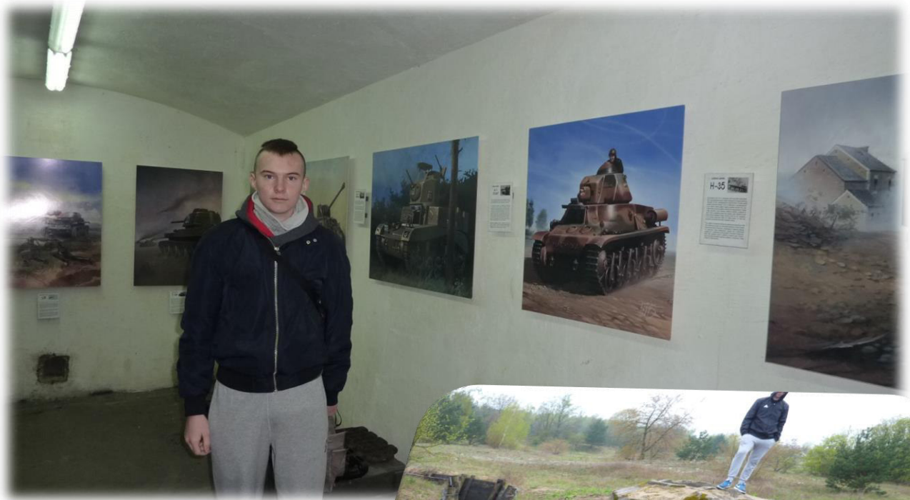
Opracował B. Żydek

Jest to XIX-wieczna Twierdza, składająca się z ponad 150 obiektów, w tym 15 dużych fortów. Prawie wszystkie zachowały się w niezmiennym stanie do dziś. Forty i schrony są własnością wojska, prywatnych firm lub też stoją zaniedbane. Fortyfikacje to zabytki techniki wojennej, wpisanymi w 1971 r. do rejestru zabytków.