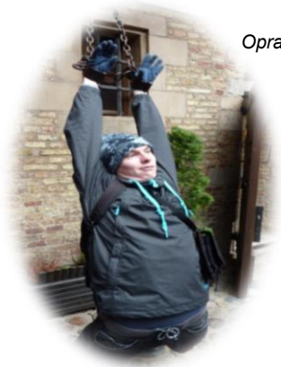
Opracowali: K. Mizera, Sz. Kołaczek

Bazylikę zaczęto budować w 1343 roku na miejscu starego kościoła NMP, a zakończona w 1361 roku. Przez wieki wielokrotnie ją przebudowywano. Bazylika ta jest największym kościołem w stylu gotyckim wykonanym z cegły. Kościół słynie z przepięknego ołtarza głównego, który przedstawia koronację Marii, a został wykonany przez Mistrza Michała z Augsburga w roku 1517.