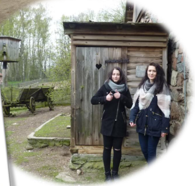
Opracowali: Ł. Graca, K. Niemczyk