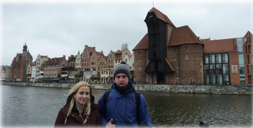
Opracowali: J. Młynarska, P. Kryta

Wyspa Spichrzów – wyspa w Gdańsku na rzece Motławie. Wyspa została utworzona po przekopaniu kanału Nowej Motławy. Od XIII w. była to dzielnica przemysłowa z licznymi spichlerzami, w XVI w. było ich już około 340. Były to duże i przestronne magazyny, z wieloma piętami, zbudowane z drewna, cegły, gliny i kamienia. Żuraw to dźwig portowy z 1442 r., obecnie część muzeum morskiego.