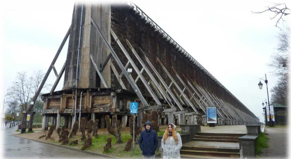
Opracowali K. Miodońska - Srokosz, N. Mikołajko

W 1836 roku zaczęto solanki wykorzystywać do celów leczniczych i datę tą przyjmuje się za oficjalne narodziny uzdrowiska. Tężnie mają wysokość 16 m i długość 1740 m.